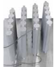
Zugstäbe aus Titan nach der Wärmebehandlung im NR 50/11 unter Argonatmosphäre