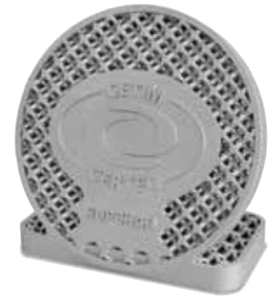
Gedrucktes Bauteil aus Aluminium, wärmebehandelt im Modell N 250/85 HA (Hersteller CETIM CERTEC auf SUPCHAD Plattform)

Das gilt auch für Prozesse, die unter Vakuum durchgeführt werden oder in Öfen, die eine hohe Anforderung an einen geringen Restsauerstoffgehalt haben. Für diese Öfen ist es wichtig, dass diese regelmäßig gereinigt und gewartet werden. Geringste Leckagen oder Verunreinigungen können zu einem unzureichenden Ergebnis führen.