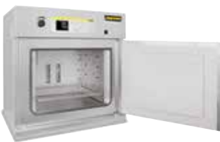
Trockenschrank TR 240 zum Trocknen von Pulvern

Nabertherm bietet Lösungen vom Aushärten der Binder zur Erhaltung der Grünfestigkeit bis hin zum Sintern im Vakuumofen an, in denen die Objekte aus Metall spannungsarm gegläht bzw. gesintert werden.