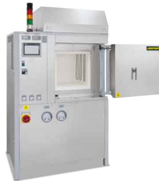
Hochtemperaturofen HT 64/17 DB100 mit passivem Sicherheitssystem zum Entbindern und Sintern an Luft

2 Bauteile ohne Restbinder. Bei geringem Restbindergehalt empfehlen wir einen Prozesseinsatzkasten