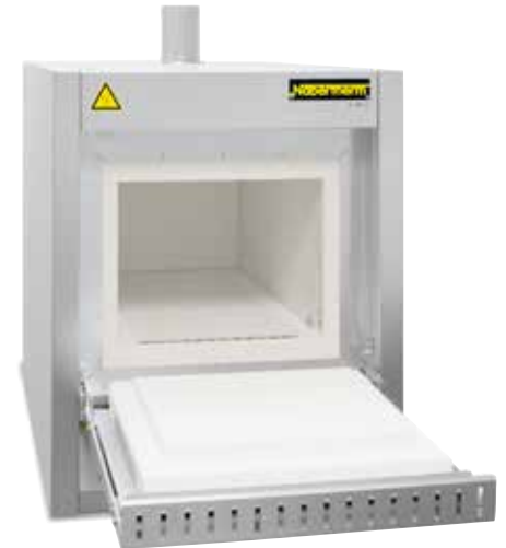
Muffelöfen L 40/11 BO mit passivem Sicherheitssystem und integrierter Nachverbrennung zum thermischen Entbindern an Luft

2 Die Öfen sind mit unterschiedlichen max. Ofenraumtemperaturen verfügbar