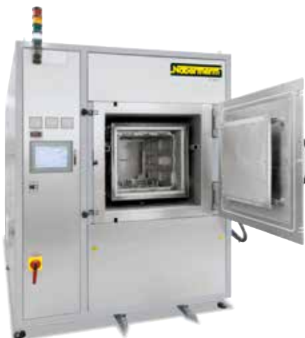
Kaltwand-Retortenofen VHT 100/12-MO für Prozesse im Hochvakuum

Für Prozesse unter Schutzgas oberhalb 1100 °C oder im Vakuum oberhalb von 600 °C kommen Kaltwand-Retortenöfen zum Einsatz.