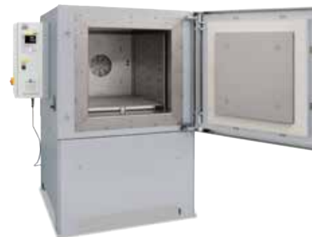
Umluft-Kammerofen NA 250/45 für Wärmebehandlungen an Luft