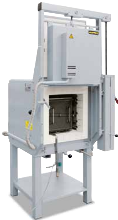
Kammerofen LH 60/12 mit Begasungskasten für Wärmebehandlungen unter Schutzgasatmosphäre