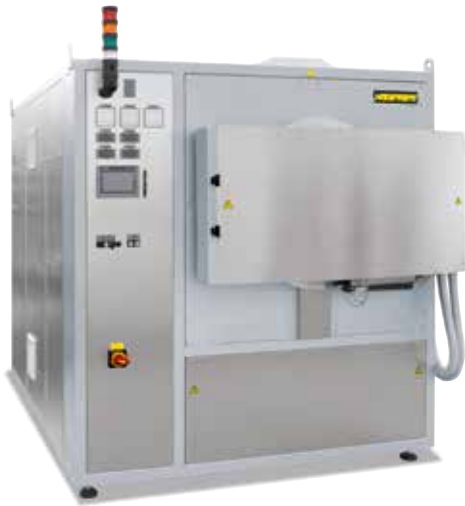
Heißwand-Retortenofen NRA 150/09 für Wärmebehandlungen unter Schutzgasatmosphäre

Bei empfindlichen Werkstoffen, wie beispielsweise Titan, ist es möglich, dass es auf Grund des Restsauerstoffgehaltes im Begasungskasten zu einer Oxidation am Bauteil kommt.