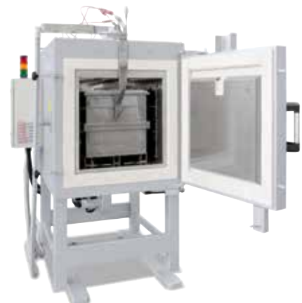
Umluft-Kammerofen N 250/85 HA mit Begasungskasten für Wärmebehandlungen unter Schutzgasatmosphäre