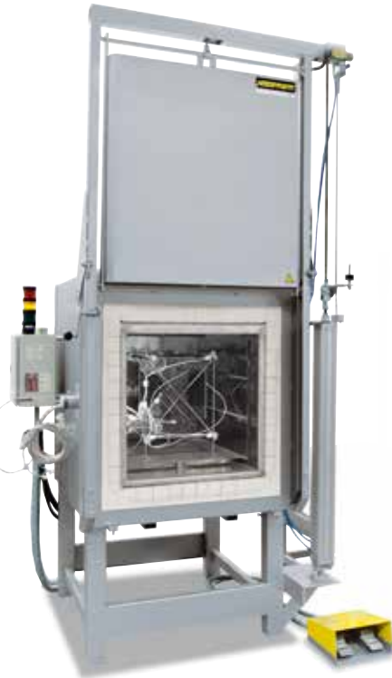
Messgestell zur Ermittlung der Temperaturgleichmäßigkeit