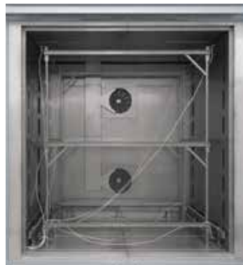
Steckbares Messgestell für Umluft-Kamerofen N 7920/45 HAS

Als Temperaturgleichmäßigkeit wird eine definierte maximale Temperaturabweichung im Nutzraum des Ofens bezeichnet. Grundsätzlich wird zwischen dem Ofenraum und dem Nutzraum unterschieden. Der Ofenraum ist das insgesamt zur Verfügung stehende Volumen im Ofen. Der Nutzraum ist kleiner als der Ofenraum und beschreibt das Volumen, welches für die Chargierung genutzt werden kann.