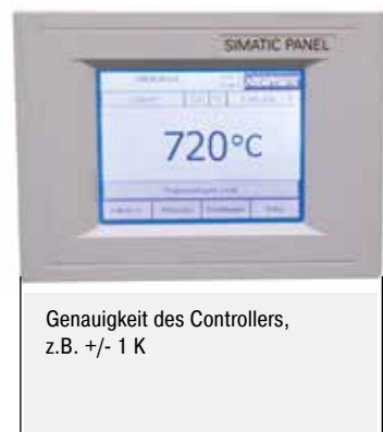
Genauigkeit des Controllers, z.B. +/- 1 K

Beim Standardofen wird eine Temperaturgleichmäßigkeit in +/- K ohne Vermessung des Ofens garantiert. Als Zusatzausstattung kann jedoch eine Temperaturgleichmäßigkeitsmessung bei einer Soll-Temperatur im Nutzraum nach DIN 17052-1 bestellt werden. Je nach Ofenmodell wird ein Gestell in den Ofen eingebracht, welches den Abmessungen des Nutzraumes entspricht. An diesem Gestell werden an definierten Messpositionen (11 mit rechteckigem Querschnitt, 9 mit kreisförmigem Querschnitt) Thermoelemente befestigt. Die Messung der Temperaturverteilung erfolgt bei einer vom Kunden vorgegebenen Soll-Temperatur nach einer vorab definierten Haltezeit. Sofern gefordert, können auch unterschiedliche Soll-Temperaturen oder ein definierter Soll-Arbeitsbereich kalibriert werden.