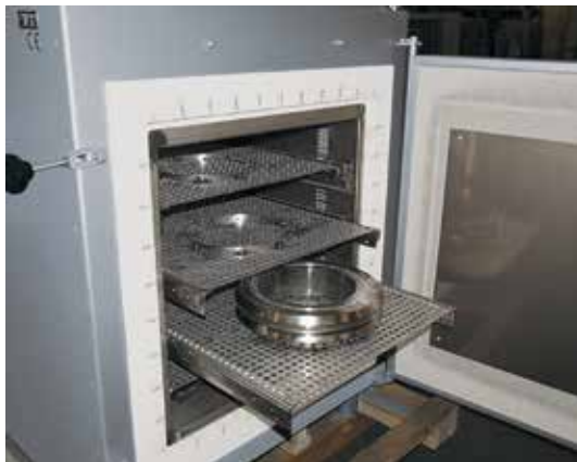
Ofenraum mit Chargierrosten in einem Umluftofen. Die Einschübe sind einzeln auf Teleskopschienen geführt und können so individuell herausgezogen werden.