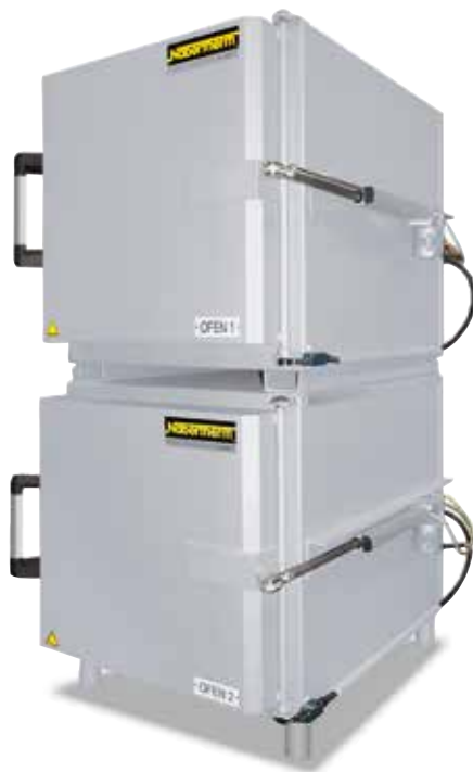
Doppelkammerofensystem bestehend aus zwei Luftumwälzöfen N 60/65 HA mit elektrischer Öffnung der Schwenktüren zum Kühlen und vereinfachten Chargieren der Öfen

Durch die Erweiterung des Ofens mit sinnvollem Zubehör zum Chargieren lässt sich der Wärmebehandlungsprozess in vielen Fällen deutlich beschleunigen oder vereinfachen bzw. die Produktivität erhöhen. Die auf diesen Seiten dargestellten Lösungen stellen nur einen Ausschnitt aus dem verfügbaren Programm dar, das wir Ihnen für diesen Bereich liefern können. Wir freuen uns auf Ihre Anfrage über Zubehör und arbeiten auch gern eine spezifische Lösung für Ihr Problem zusammen mit Ihnen aus.