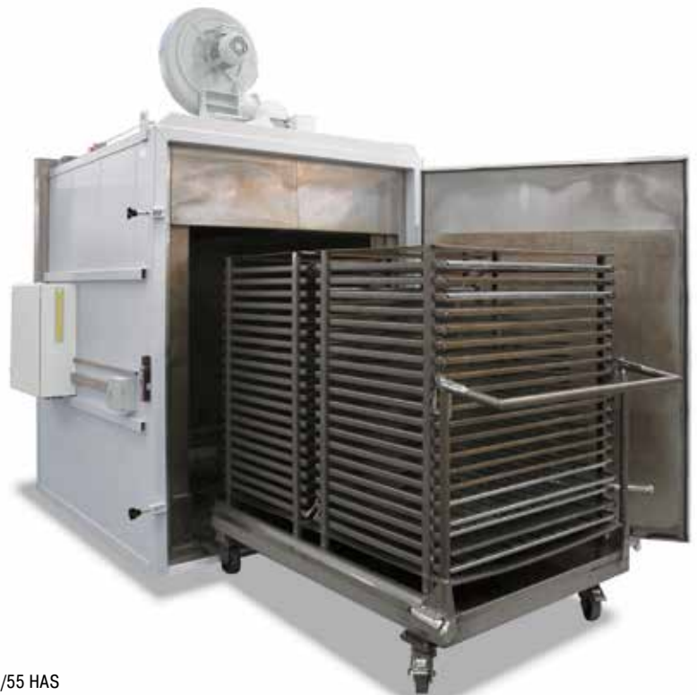
N 2380/55 HAS Umluftofenanlage inkl. Chargierwagen zum Anlassen von flachen Blechen