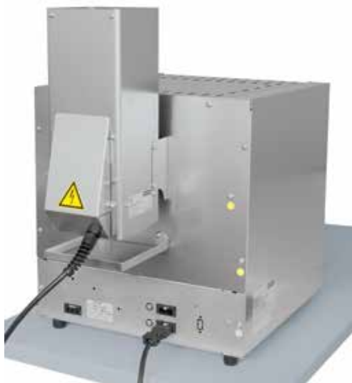
Standard-Labormuffelofen L 5/11 mit Katalysator KAT 50 siehe Seite 12

Zur Abluftreinigung, insbesondere beim Entbindern, bietet Nabertherm auf den Prozess zugeschnittene Abgasreinigungssysteme an. Die Nachverbrennung wird fest an den Abgasstutzen des Ofens angeschlossen und entsprechend in die Regelung und in die Sicherheitsmatrix des Ofens eingebunden. Für bereits bestehende Ofenanlagen können auch ofenunabhängige Abgasreinigungssysteme angeboten werden, die separat geregelt und betrieben werden können.