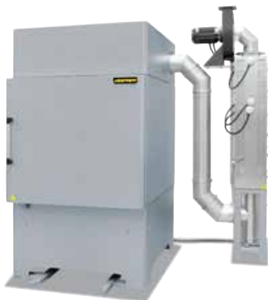
Kammerofen NA 500/65 DB200 mit katalytischer Nachverbrennungsanlage