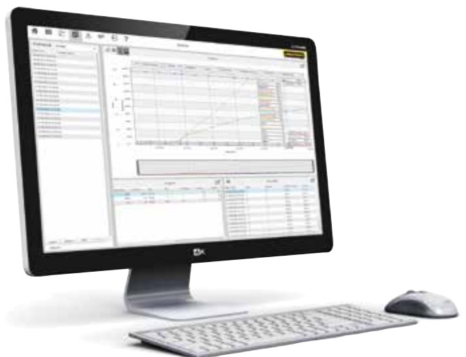
VCD-Software zur Steuerung, Visualisierung und Dokumentation