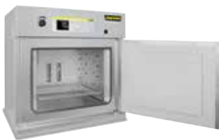
Trockenschrank TR 240 zum Trocknen von Pulvern

In den meisten Fällen müssen diese Objekte nach dem Druck wärmebehandelt werden. Nabertherm bietet Lösungen vom Aushärten der Binder zur Erhaltung der Grünfestigkeit bis hin zum Vakuumofen an, in denen die Objekte aus Metall spannungsarm gegläht bzw. gesintert werden.