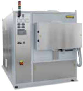
Retortenofen NR 150/11 zum Spannungsarmglühen von Metall-Bauteilen nach dem 3D-Druck

Die additive Fertigung ermöglicht die direkte Umwandlung von Konstruktionsdateien in voll funktionsfähige Objekte. Über den 3D-Druck werden Objekte aus Metall, Kunststoff, Keramik, Glas, Sand oder anderen Materialien schichtweise aufgebaut, bis sie ihre fertige Gestalt erreicht haben.