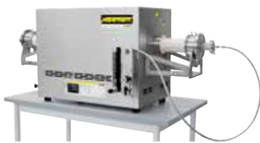
Kompakter Rohrofen zum Sintern oder Spannungsarmglühen nach dem 3D-Druck unter Schutzgas oder Vakuum